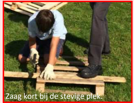
Zaag kort bij de stevige plek.