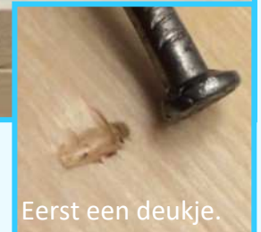
Eerst een deukje.