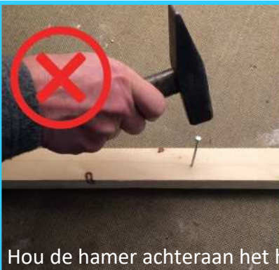
Hou de hamer achteraan het handvat vast.