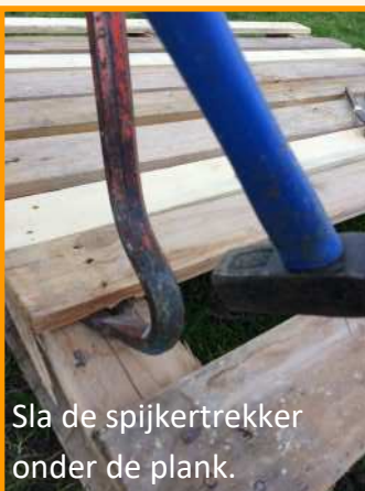
Sla de spijkertrekker onder de plank.